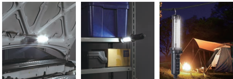
ボンネット内側に取り付けて車の整備などの作業用照明に ガレージや倉庫などでの暗所照明に 吊り下げフックを使用してレジャー照明に